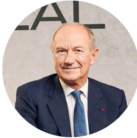
JEAN-PAUL AGON Président Directeur Général de L'Oréal

«Le Groupe L'Oréal est particulièrement fier de faire partie de l'équipe fondatrice soutenant la création de ce nouveau Centre d'analyse de données et d'intelligence artificielle (IA).