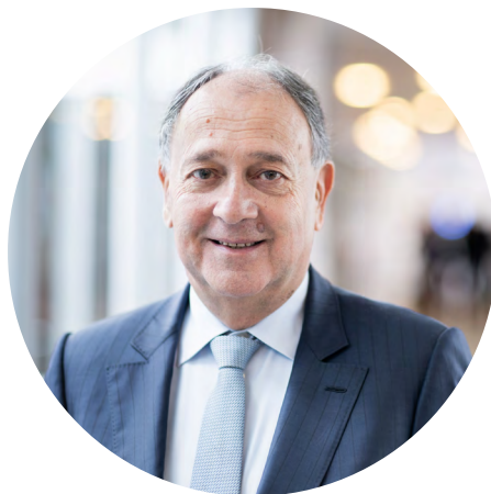
PAUL HERMELIN Président du Conseil d'Administration du groupe Capgemini

« Travailler les données est au cœur des métiers de Capgemini et nécessite une double culture, mathématique et sociétale. L'alliance de ces deux institutions prestigieuses - HEC Paris et l'Institut Polytechnique de Paris - permet précisément de réunir le meilleur des intelligences du monde du business, de la compréhension sociale, d'une part, et des algorithmes, de l'informatique, d'autre part. Il était donc naturel pour nous et enthousiasmant d'y apporter notre soutien.