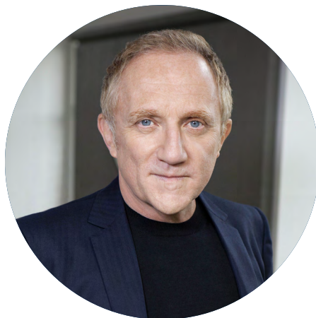
FRANÇOIS-HENRI PINAULT Président Directeur Général de Kering